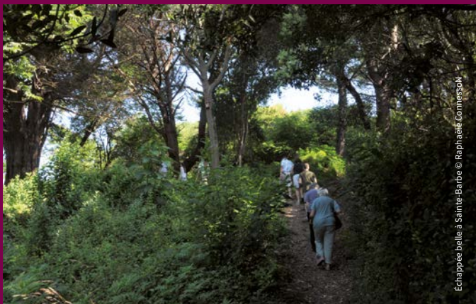
Echappée belle à Sainte-Barbe