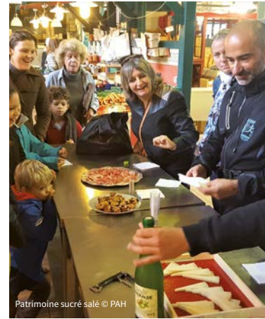
Patrimoine sucré salé