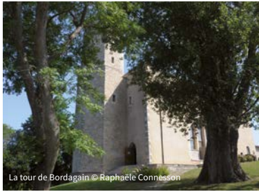
La tour de Bordagain