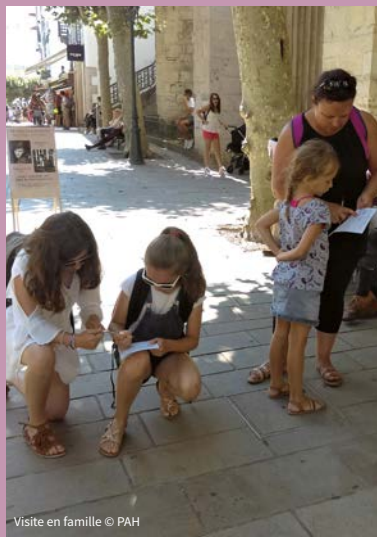
Visite en famille

*Activité familiale en autonomie. Enfants à partir de 7 ans.