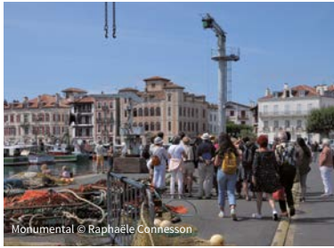
Monumental © Raphaële Connesson