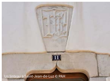
Un linteau à Saint-Jean-de-Luz