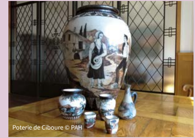
Poterie de Ciboure