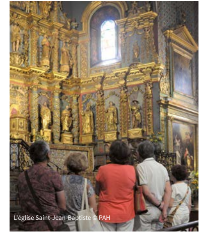
L'église Saint-Jean-Baptiste

LUNDI 28 OCTOBRE JEUDI 26 DÉCEMBRE RDV : 16h00, Ciboure, église Saint-Vincent