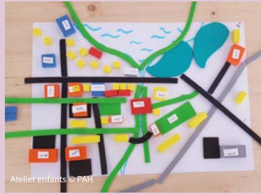
Ateliers enfants © PAH