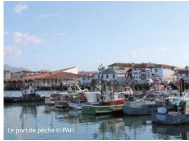
Le port de pêche