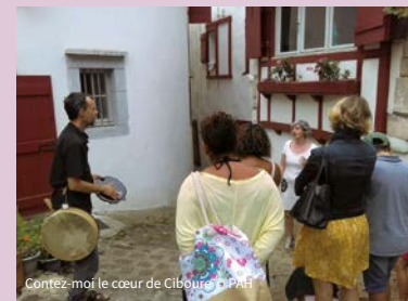
Contez-moi le cœur de Ciboure