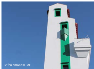
Le feu amont