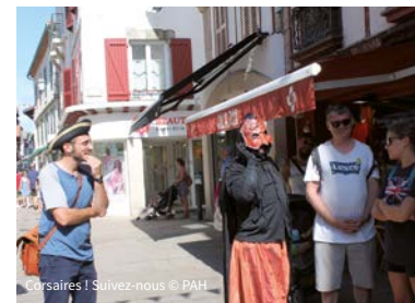
Corsaires ! Suivez-nous

Δ Sur inscription dans les Offices de Tourisme / Izena emanez Turismo Bulegoetan