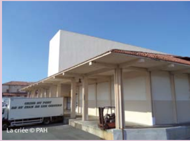
La criée