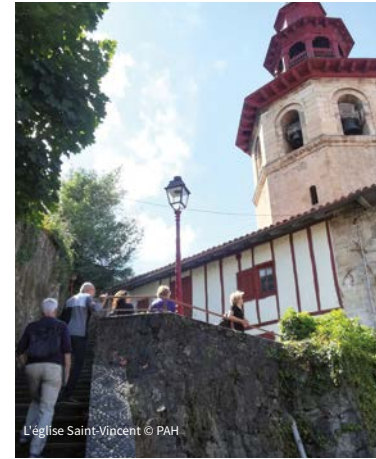
L'église Saint-Vincent

Gratuit moins de 16 ans / Urririk 16 urtetik beherakoentzat