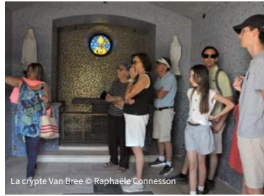
La crypte Van Bree