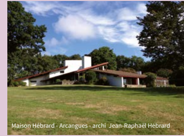
Maison Hébrard - Arcangues - archi Jean-Raphaël Hébrard