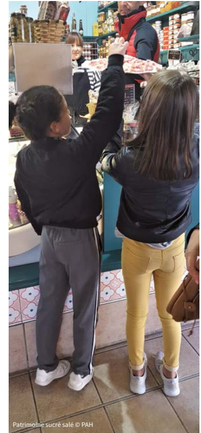
Patrimoine sucré salé

SAMEDIS 9 NOVEMBRE ET 28 DÉCEMBRE RDV : 10h00, Saint-Jean-de-Luz, Office de Tourisme (20, bd Victor Hugo)