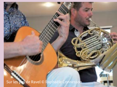
Sur les pas de Ravel